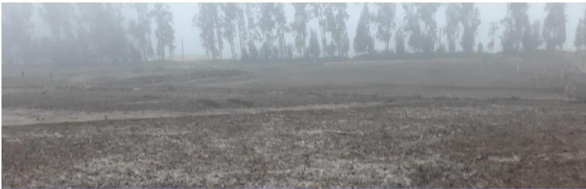
Unnamed Road, Melipilla, Región Metropolitana, Chile Date:- 15-10-2020 Time:- 7:24 a. m.