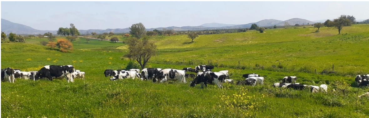
Unnamed Road, Melipilla, Región Metropolitana, Chile Date:- 14-10-2020 Time:- 3:12 p. m.