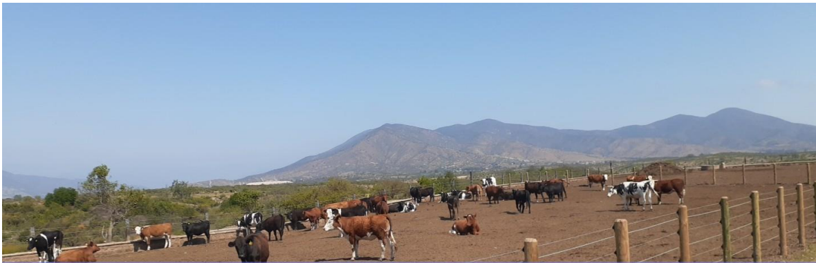
Unnamed Road, Melipilla, Región Metropolitana, Chile Date:- 14-10-2020 Time:- 3:29 p. m.