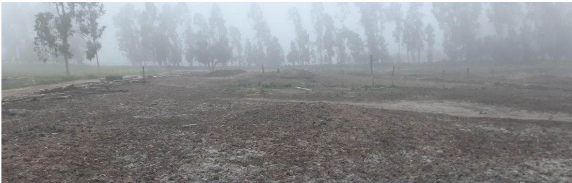
Unnamed Road, Melipilla, Región Metropolitana, Chile Date:- 15-10-2020 Time:- 7:24 a. m.