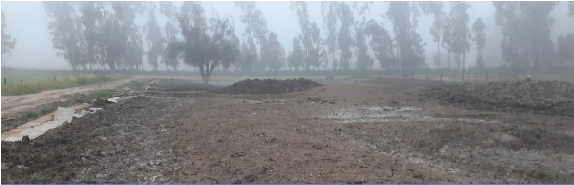
Unnamed Road, Melipilla, Región Metropolitana, Chile Date:- 15-10-2020 Time:- 7:25 a. m.