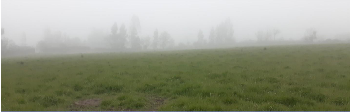
Unnamed Road, Melipilla, Región Metropolitana, Chile Date:- 15-10-2020 Time:- 7:25 a. m.