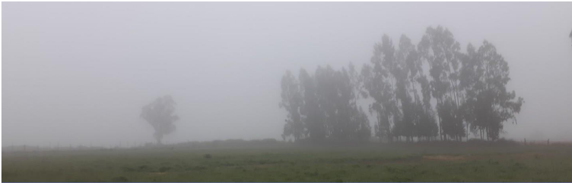
Unnamed Road, Melipilla, Región Metropolitana, Chile Date:- 15-10-2020 Time:- 7:26 a. m.