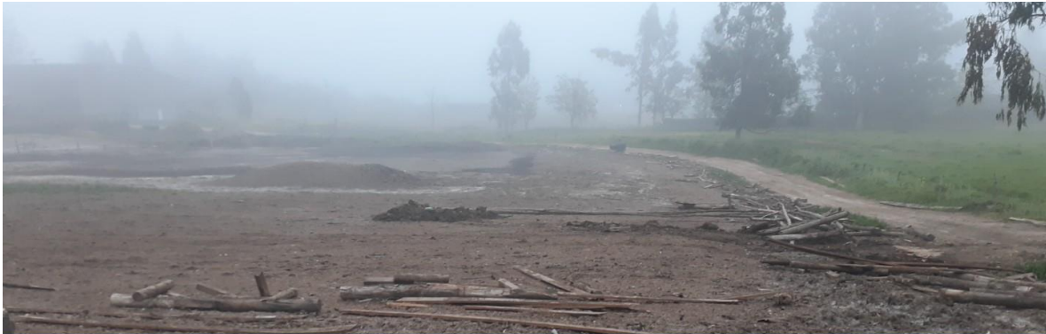
Unnamed Road, Melipilla, Región Metropolitana, Chile Date:- 15-10-2020 Time:- 7:23 a. m.