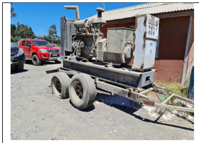
Figura 2 Fotografía del Grupo electrógeno Diesel a un costado de la sala de control de la planta de hormigón.