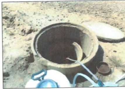
Fotografía 1: Punto de Muestreo