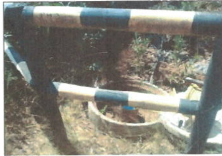
Fotografía 1: Punto de Muestreo