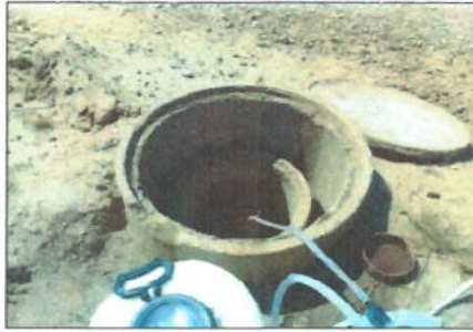
Fotografía 1: Punto de Muestreo