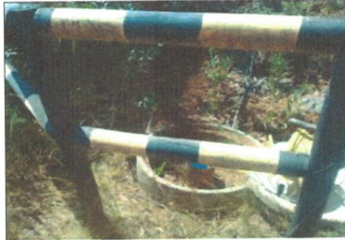
Fotografía 1: Punto de Muestreo