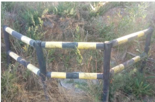
Punto de muestreo