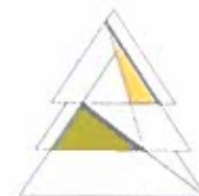
Tabla 1: Análisis del artículo 3 del Reglamento del SEIA

Del mismo modo, al ajuste no le resulta aplicable ninguna de las demás tipologías a que se refiere el artículo 3 del Reglamento del SEIA, tal como se deduce del análisis pormenorizado que se presenta a continuación: