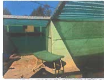
Ilustración 5. Jaula para rehabilitación