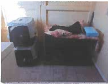
Ilustración 6. Jaulas trampa