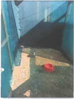
Ilustración 4. Sala de cuidados