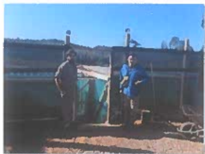
Ilustración 2. Entrada zona de cuidado