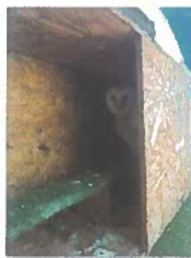
Ilustración 3. Ave rescatada