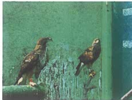
Ilustración 8. Aves en recuperación