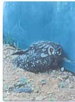
Ilustración 7. Ave rescatada en tratamiento