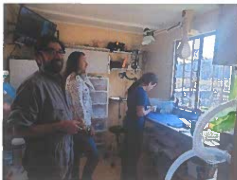
Ilustración 1. Sala de tratamiento