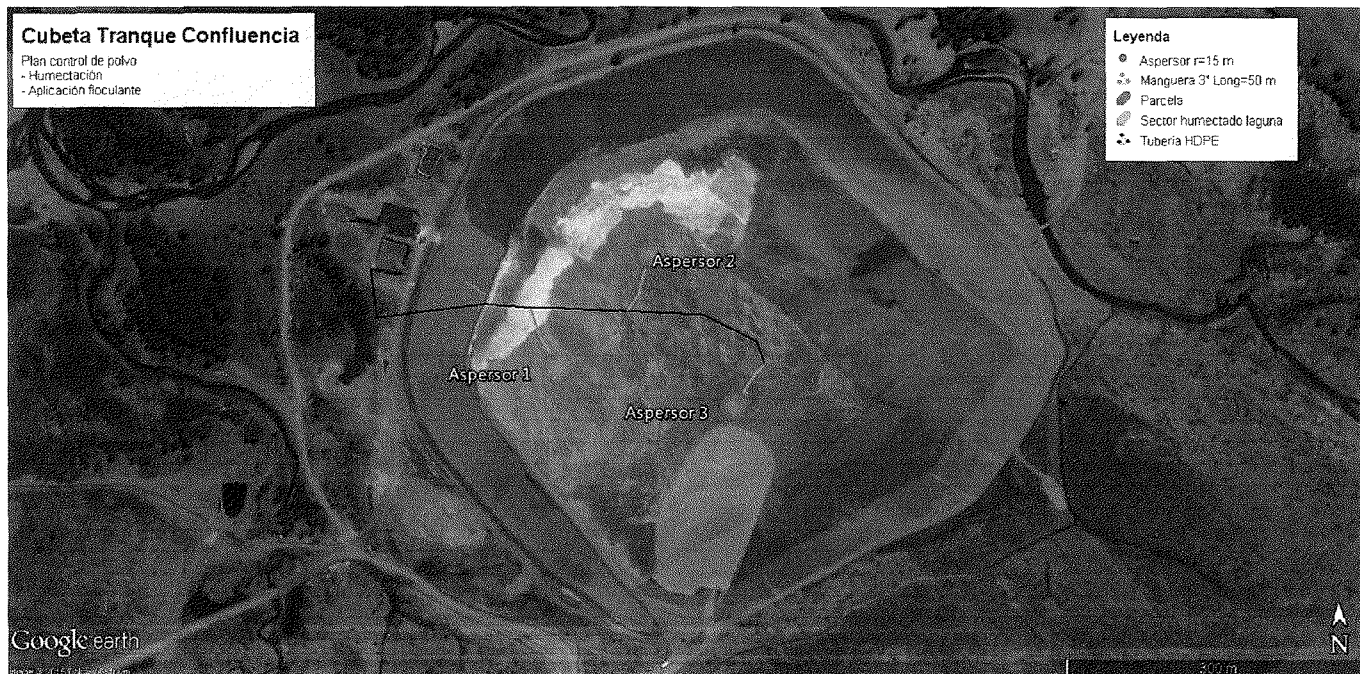
Figura 1. Distribución del sistema de humectación.

En la figura 1, se puede apreciar en color verde, las parcelas que se han cubierto con floculante equivalente a 7,15 hectáreas. En color azul, la zona de humectación permanente con 1,3 hectáreas.