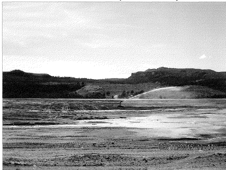
Foto 5. Distancia de dispersión del aspersor.

Paralelamente a los aspersores, se utiliza el sistema de humectación móvil que abarca las zonas no humectadas y de difícil acceso (ver foto 2).